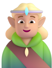
Data Science Specialist

Cum? Fiecare echipă este formată din 5 participanți dintre care cel puțin unul cu profil tehnic. Dacă ai deja o echipă, te felicităm! Dacă nu, don't worry. Vino doar cu dorința de a lucra iar echipa o poți crea împreună cu alți participanți determinați care sunt în aceeași situație ca și tine.